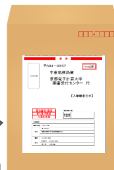
出願書類提出用封筒

市販の角形2号封筒に「出願書類提出用封筒宛名シート」を貼り付けて必要書類を封入してください。